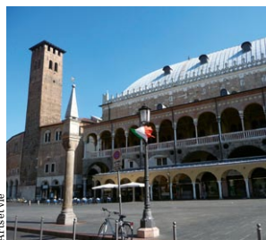
Arts et vie

Arts et vie, dont la réputation n'est plus à faire en matière de voyages intelligents, propose une immersion culturelle dans les plaines de la Vénétie, entre la mer Adriatique et les Alpes, en plein cœur de la région chère à Shakespeare. C'est à partir de Bologne que commence le périple dans lequel s'enchaînent les perles de l'Unesco, villes-musées remplies de chefs-d'œuvre et prêtes à livrer leurs secrets: Ravenne, Ferrare, Padoue, Vicence et Venise, avec leurs palais, châteaux, églises, mausolées, écrins de la maestria de Giotto, du Tintoret, de Giorgione, d'Altichiero da Zevio, de Titien, etc. Les incroyables villas palladiennes de Barbaro et Emo ainsi que le théâtre Olympique ont bien sûr une place de choix dans ce voyage qui s'achève, tout naturellement, à Venise. De quoi devenir incollable sur cette région d'Italie. ■ Prix: 1 750 € environ. Infos: www.artsetvie.com