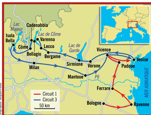
Infographie: Hugues Piolet

Jour 1: arrivée, transfert à proximité de Venise. Jour 2: départ pour Vérone et visites guidées de la ville, de la presqu'île fortifiée de Sirmione et du lac de Garde (le plus grand d'Italie), où vous passerez la nuit. Jour 3: direction le lac de Côme via Bergame et Lecco. Traversée en bac de Varenna à Bellagio puis croisière en bateau de ligne de Cadenabbia jusqu'à Côme pour une nuit au bord du célèbre lac. Jour 4: minicroisière aux îles Borromées sur le lac Majeur (Isola Bella et ses jardins à l'italienne). Arrivée à Milan l'après-midi: visite du Dôme, du théâtre de la Scala, du château des Sforza, etc. Nuit à Milan. Jour 5: départ pour Mantoue, visite du centre historique puis découverte de Vicence et de ses merveilles. Jours 6 et 7: bateau privé pour Venise, fascinante entre ciel et eau. Deux jours ne seront pas de trop pour découvrir la Sérénissime et ses environs. Jour 8: retour. ■ Prix: à partir de 1 099 €/ personne. Infos: 02 98 73 19 90 et www.salaun-holidays.com